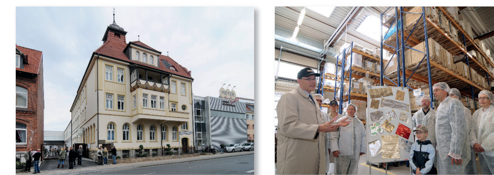
Firmengebäude Hildesheimer Straße Besucherführung durch den Betrieb