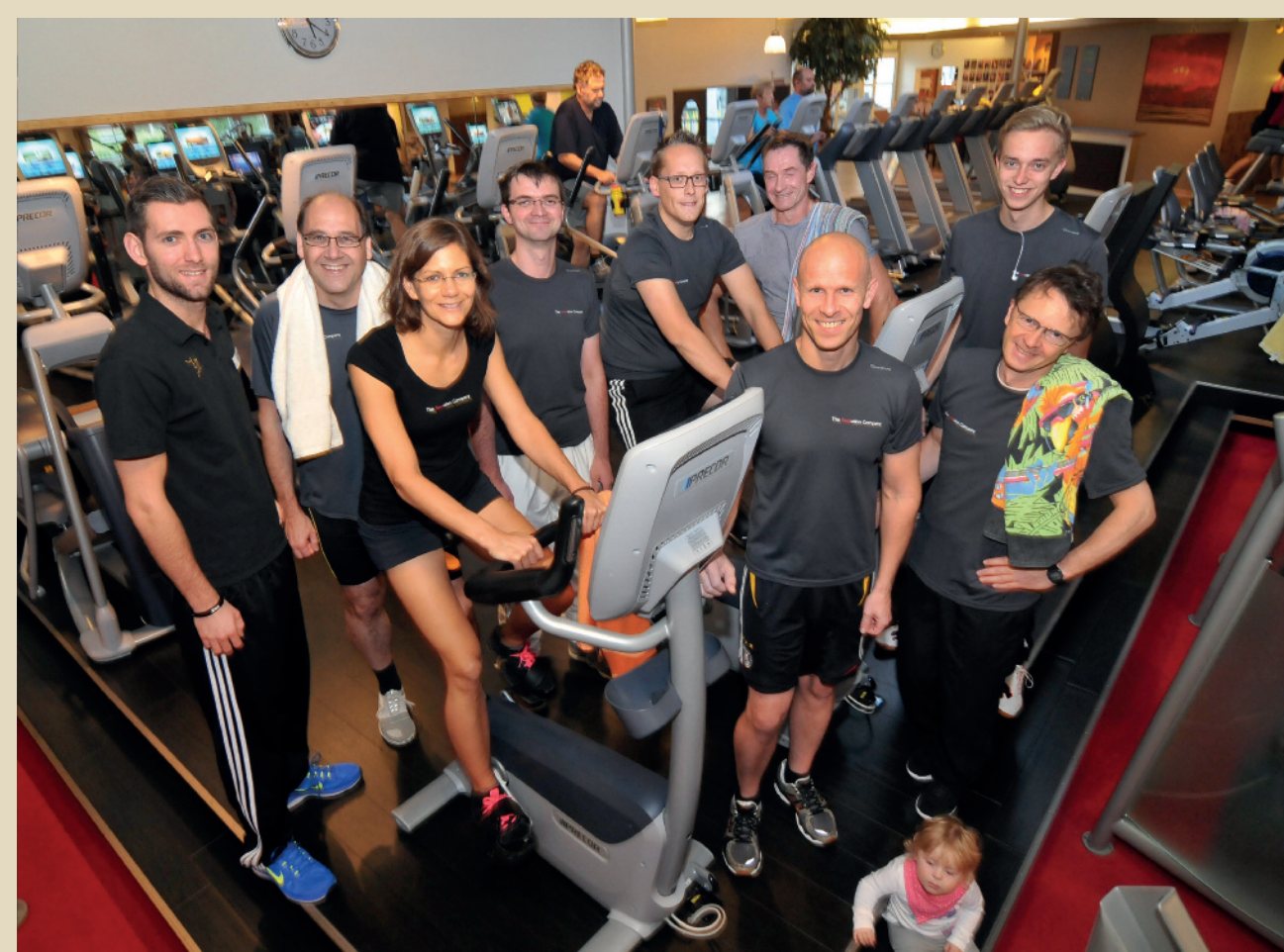
Mitarbeiter von Meyer Seals im Fitnessclub

Bei Meyer Seals arbeitet ein „buntes“ Team aus mehr als zehn verschiedenen Nationalitäten mit Professionalität und Leidenschaft. Insbesondere in der Vertriebsmannschaft ist die Internationalität wichtig. Experten von Meyer Seals aus allen Fachgebieten sind weltweit im technischen Kundendienst tätig.