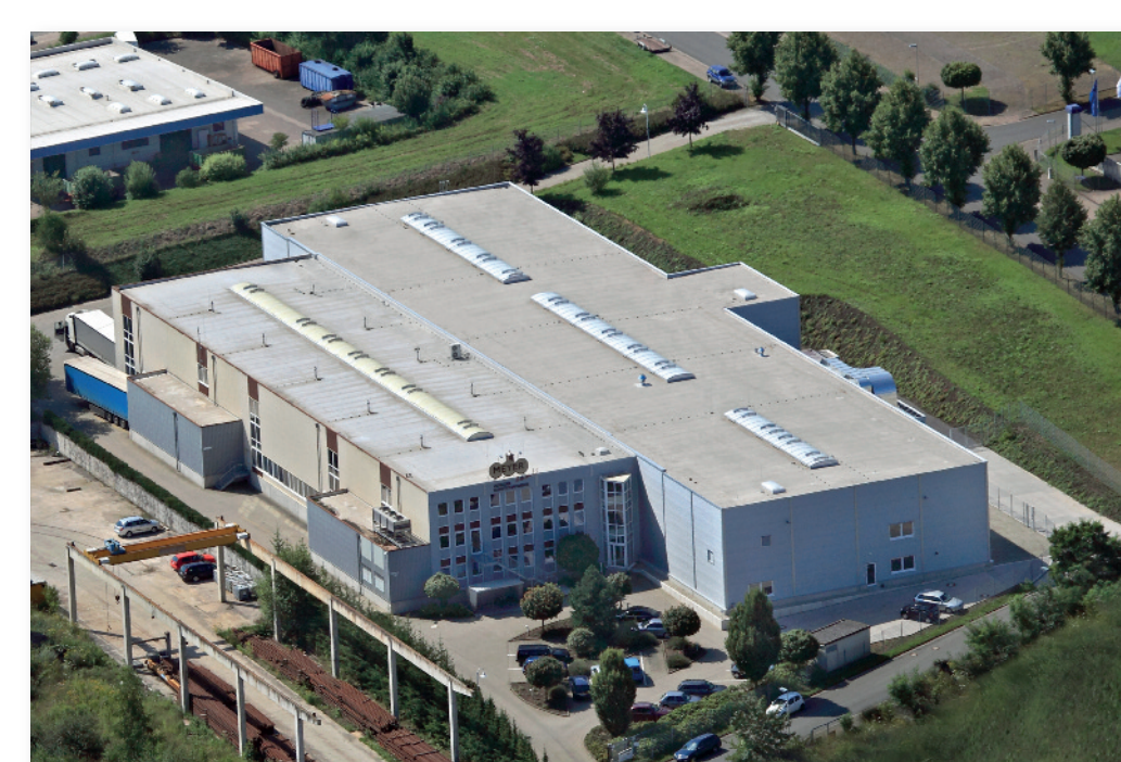
Die Produktionsstätte Limmer-West