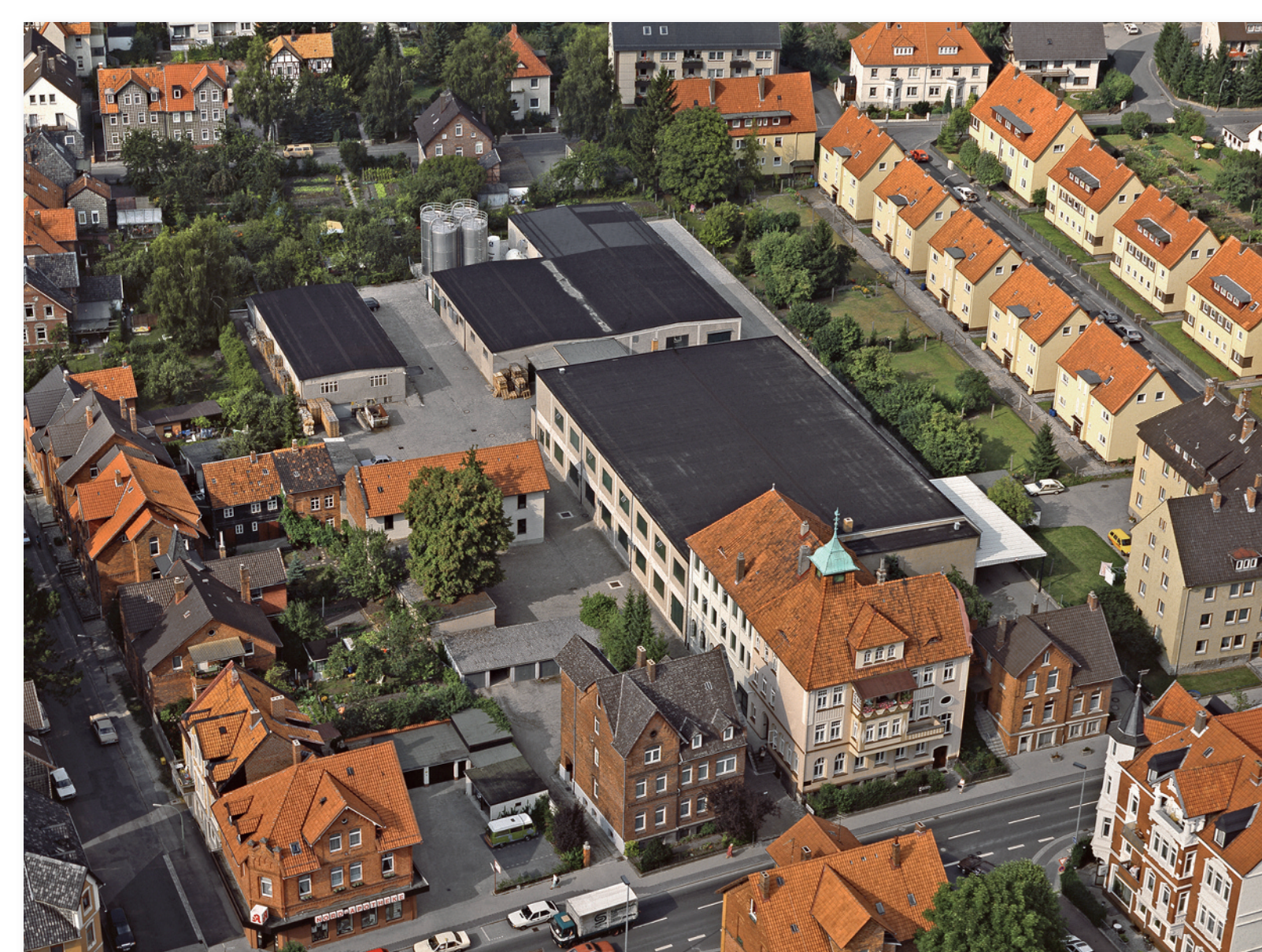
Die Produktionsstätte an der Hildesheimer Straße im Jahr 1988 und...

Mit „Turbine Tab“ hat Meyer Seals die Angebotspalette um ein besonders anwenderfreundliches Produkt erweitert. Ökonomie und einfache Handhabbarkeit verbinden sich zu echtem Mehrwert für die gesamte Lieferkette.