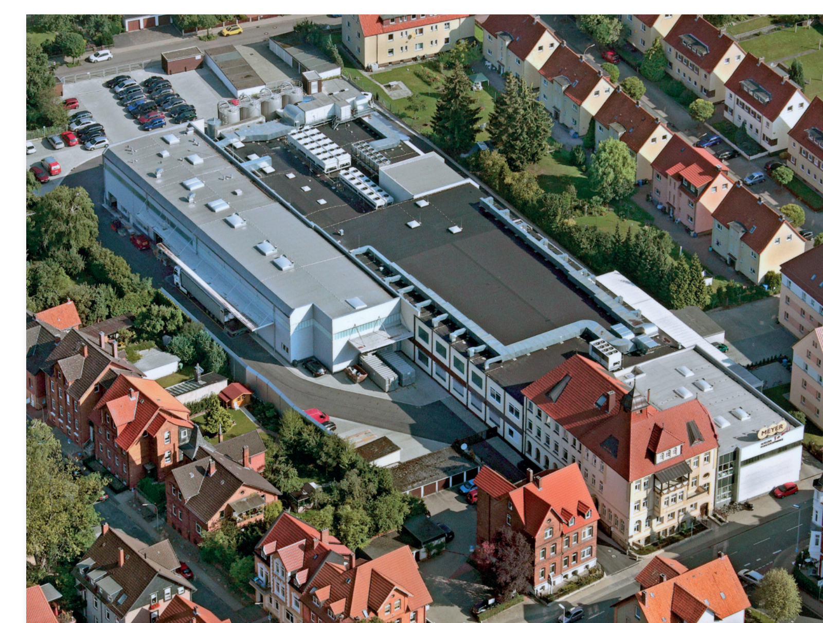
2011 nach dem Bau einer neuen Halle inkl. Maßnahmen zur Geräuschreduktion