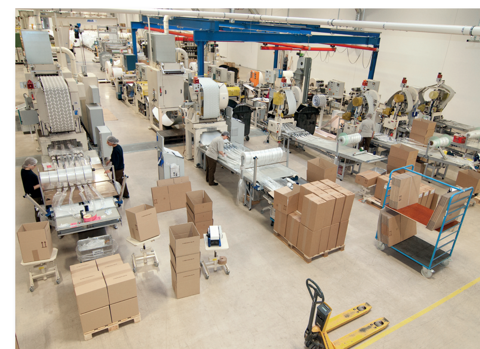
Limmer West: Die moderne Halle bietet beste Arbeitsbedingungen.