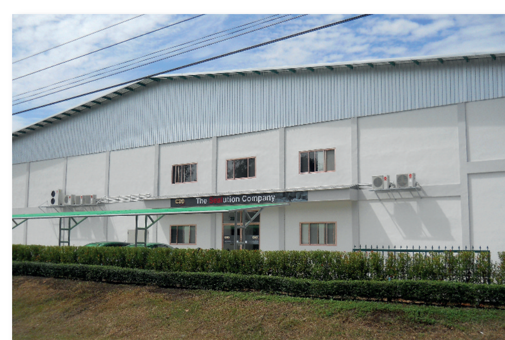
Das Werk in Thailand