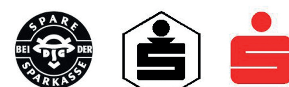
Das Logo der Sparkasse 1925, 1948 und 1971

Den markanten Rotton, als HKS 13 bezeichnet, erhielt es 1972. Seitdem ist es bei Tag und Nacht, in Stadt und Land schon von Weitem erkennbar und leitet die Kunden zielgenau in die nächstliegende Geschäftsstelle.