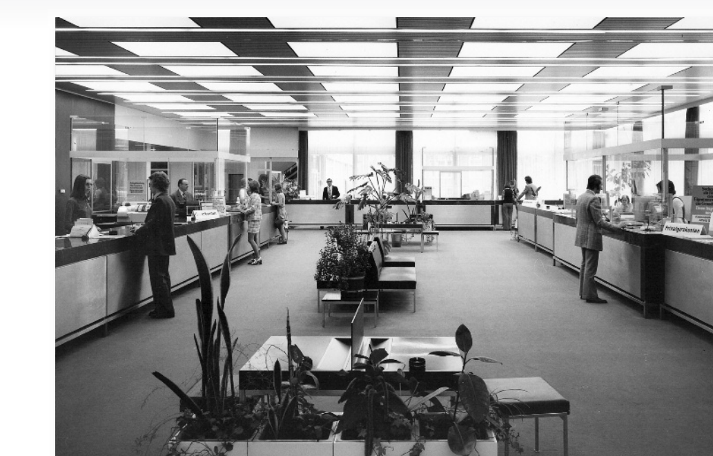
Die Kundenhalle im Jahre 1972