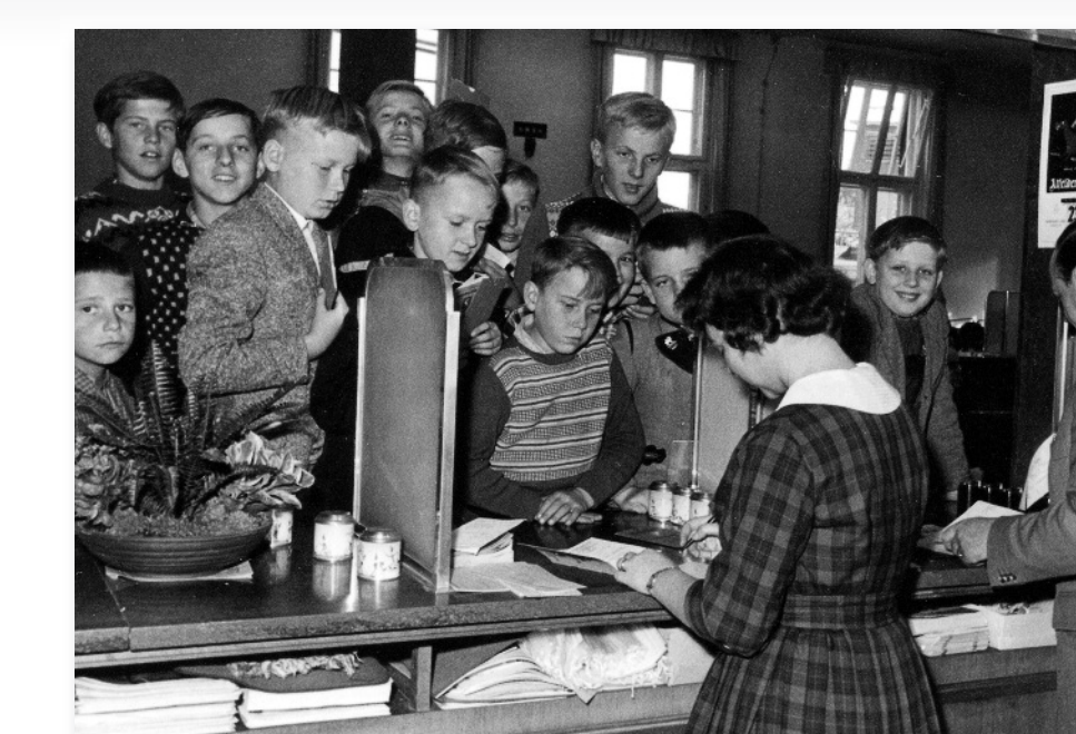
... das Ersparte wird verbucht