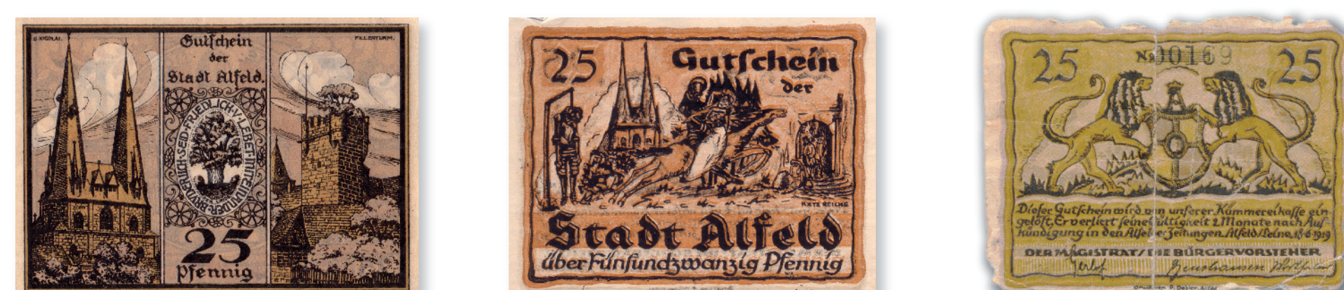
Alfelder Notgeld aus den 1920er Jahren