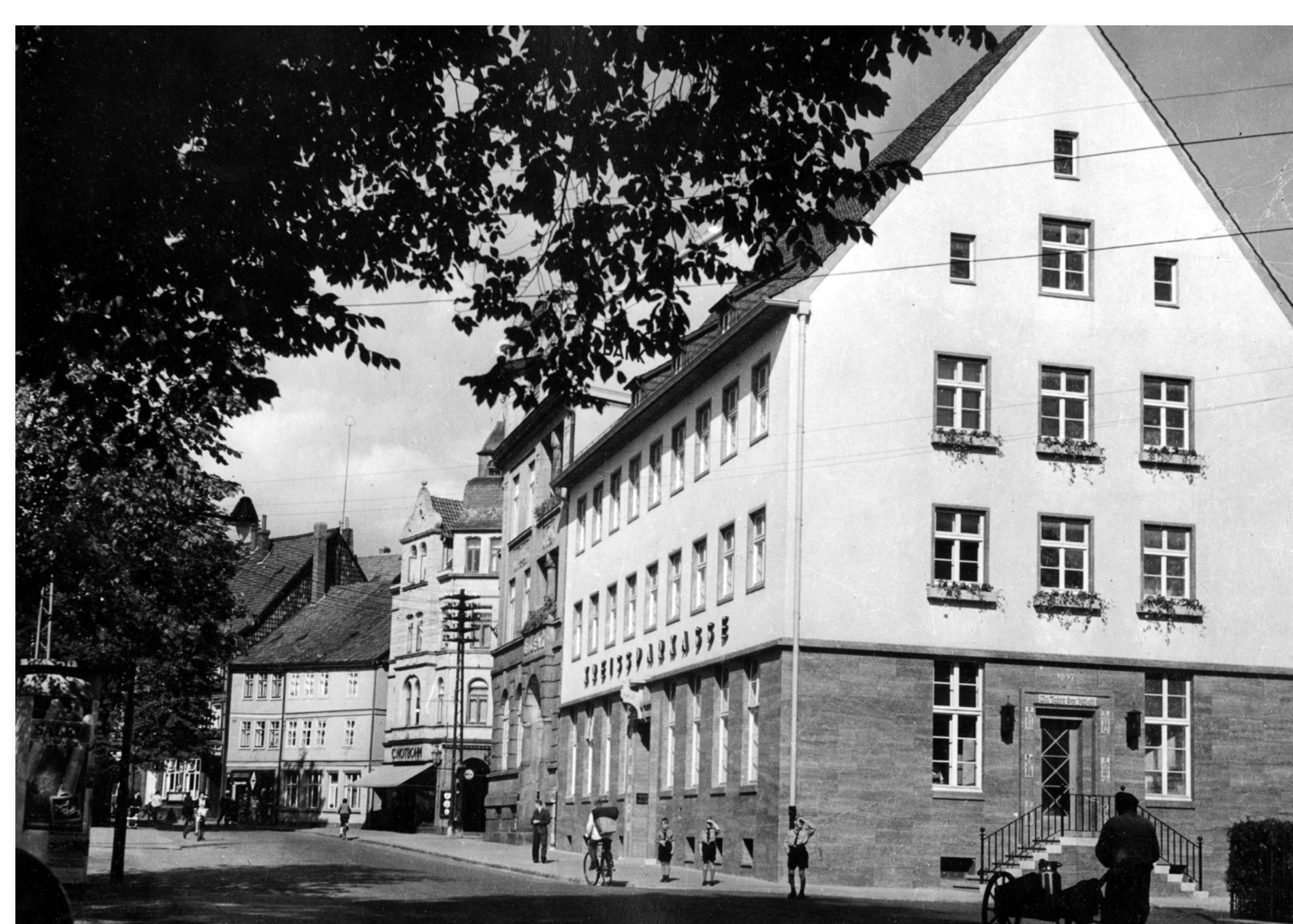
Das Gebäude der neu errichteten Kreissparkasse im Jahre 1938