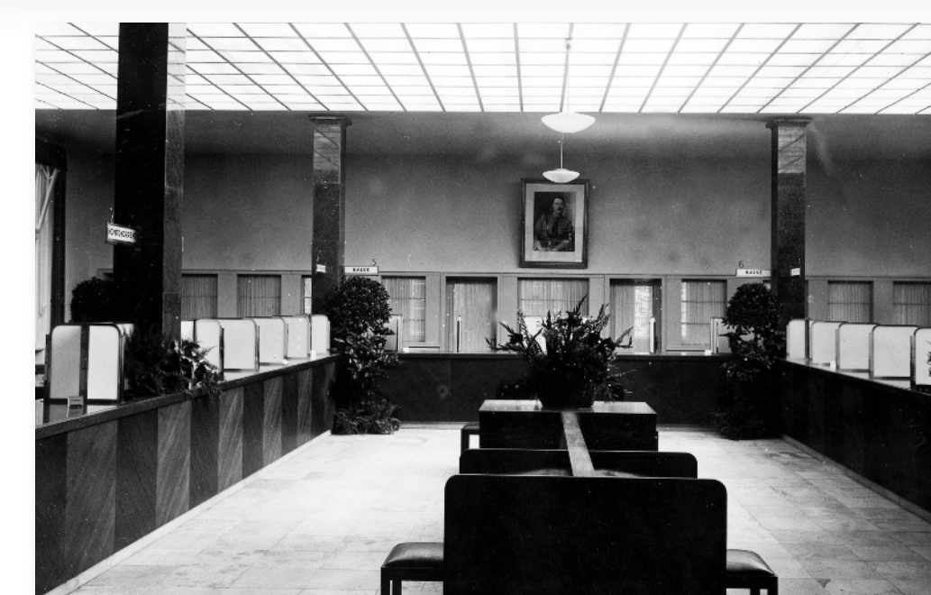
Die Kassenhalle im Jahre 1938