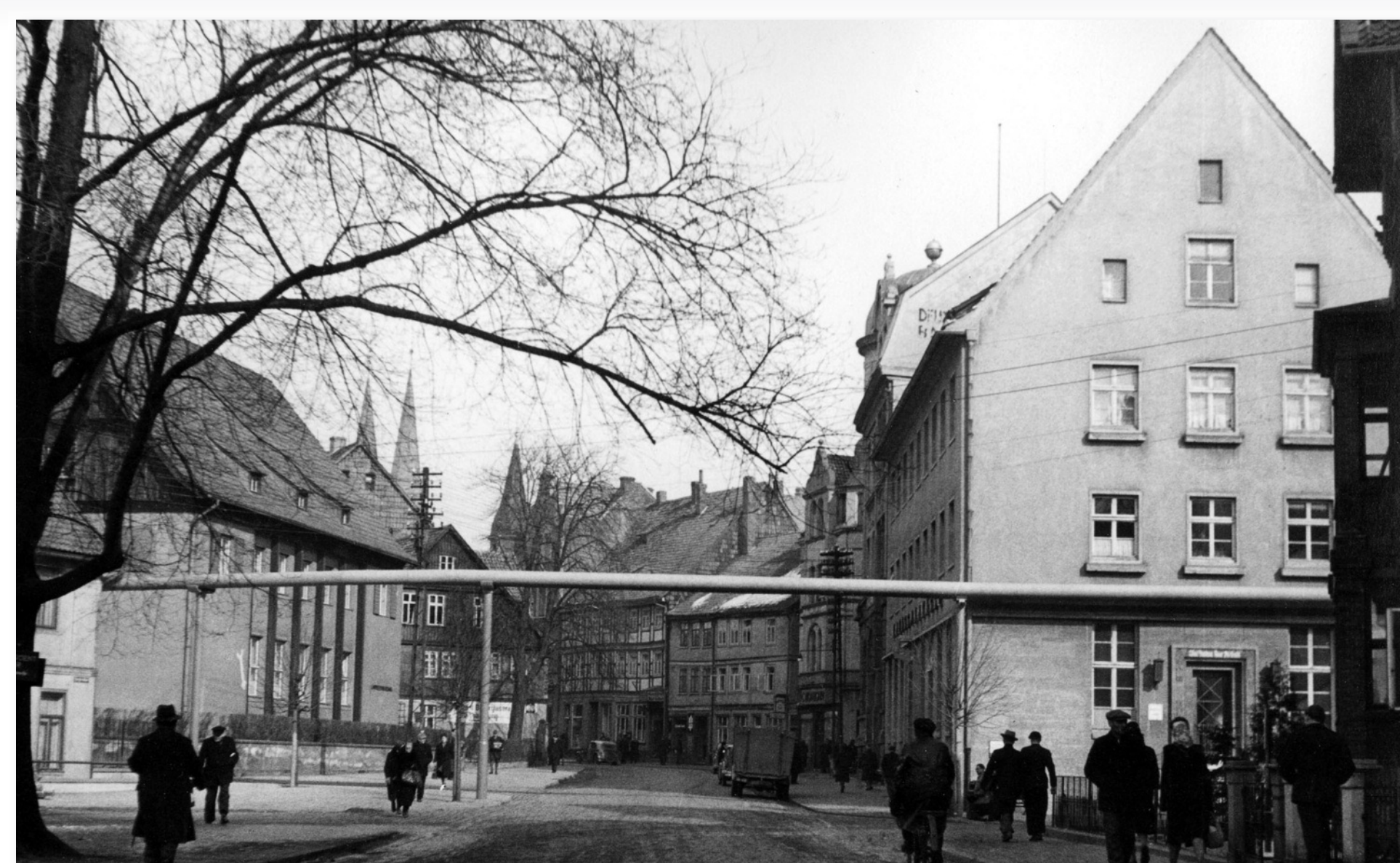
Die ehemalige Landeszentralbank, die Kreissparkasse und die „Röhre“ in den 1950er Jahren

● Weitere Standorte des Industrie-Kultur-Pfades ■ Standort Sparkasse