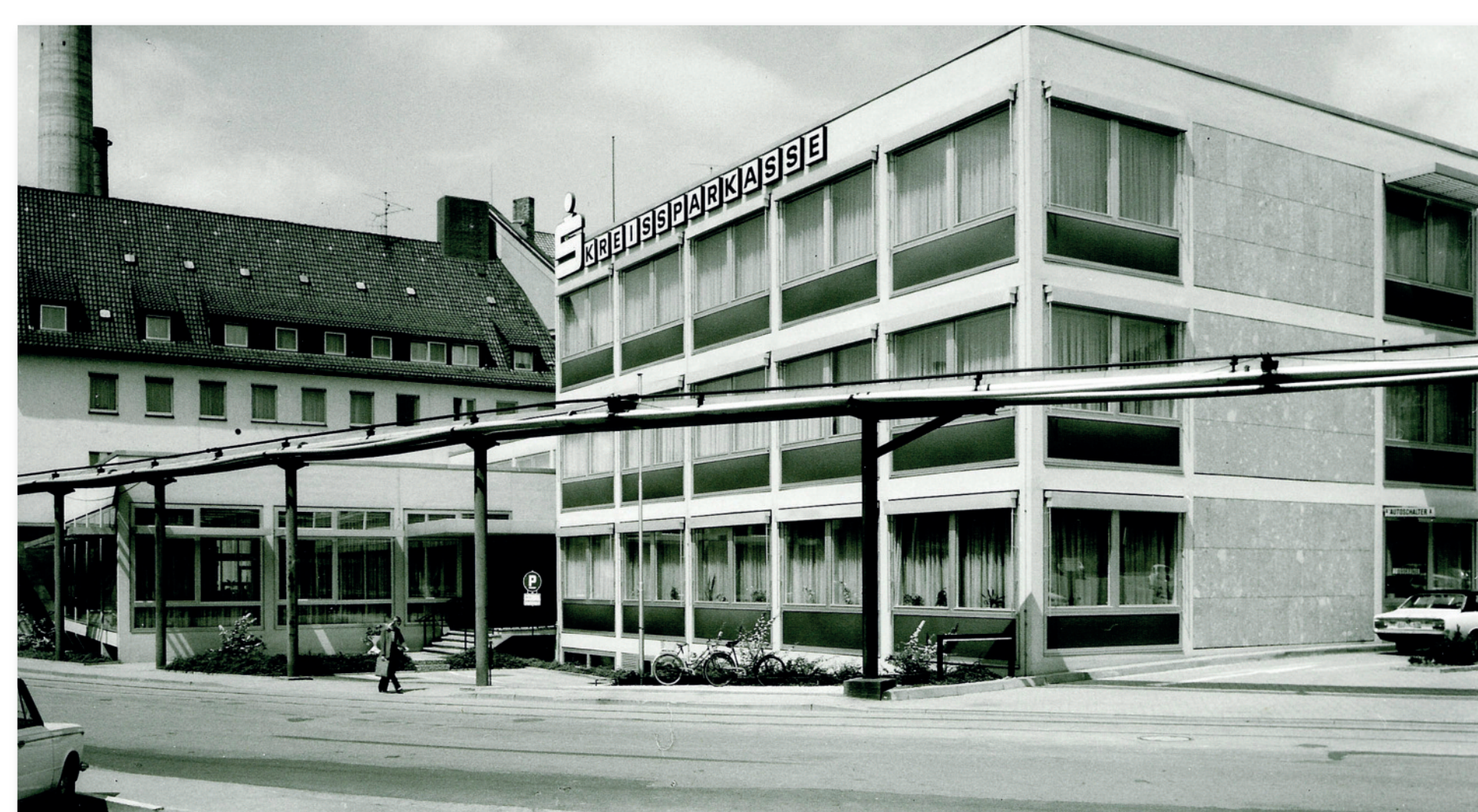
Der Erweiterungsbau von 1972

Aber wer weiß, dass das Sparkassen-S bereits 1938 von Lois Gaigg (genaue Lebensdaten unbekannt) entworfen wurde? In seiner ursprünglichen Version war das S noch deutlicher als stilisierte Spardose mit Einwurfschlitz zu identifizieren, in die eine Münze fällt. Der Einwurfschlitz fiel um 1981 einer Modernisierung durch den Grafiker Otl Aicher (1922–1991) „zum Opfer“.