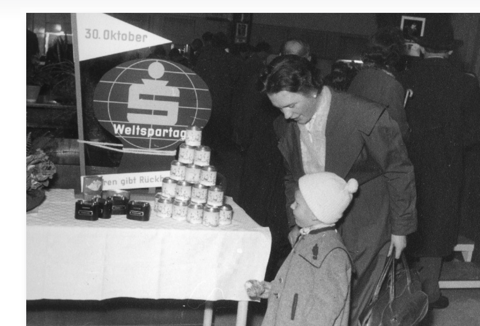
Weltspartag am 30. Oktober 1959