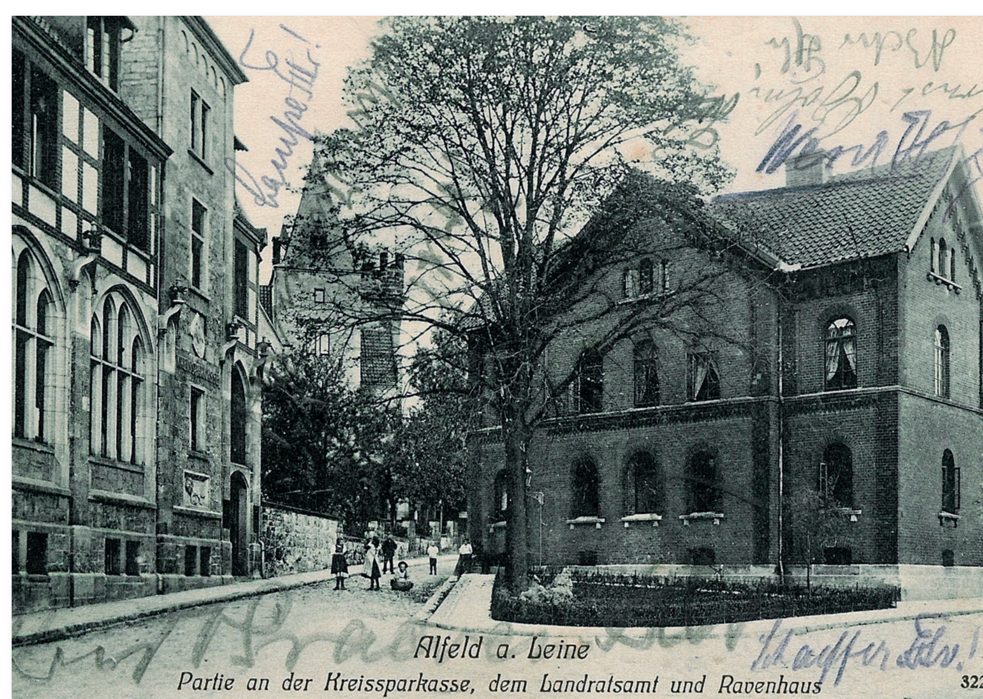
Das Ravenshaus (rechts) und die Kreissparkasse (links), 1910

Ihr starkes Engagement in den verschiedensten gesellschaftlichen Bereichen trägt in erheblichem Maße zur Steigerung der Lebensqualität in der Region bei. Jahr für Jahr werden mit beträchtlichen Beträgen Projekte aus den Bereichen Kunst, Kultur, Sport, Umwelt, Wissenschaft und Soziales unterstützt.